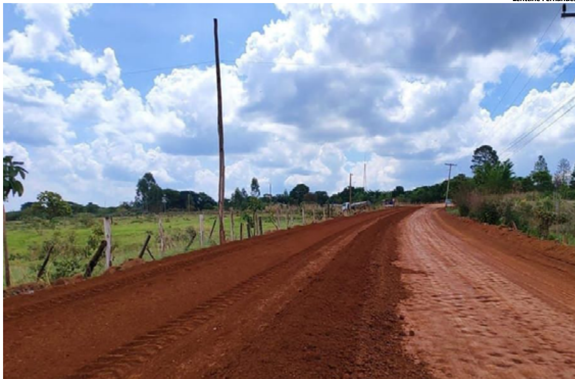
Estrada Real liga o Distrito de Monte Alto aos bairros da região da Vendinha, correspondente a 9 km de estradas vicinais