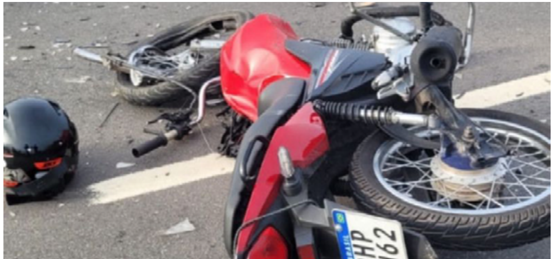
Estudo somou mais de 260 mil internações hospitalares na rede pública por sinistros de trânsito

“A sociedade também ficou muito ansiosa e deprimida com a pandemia [de Covid-19] e passou a usar medicamentos