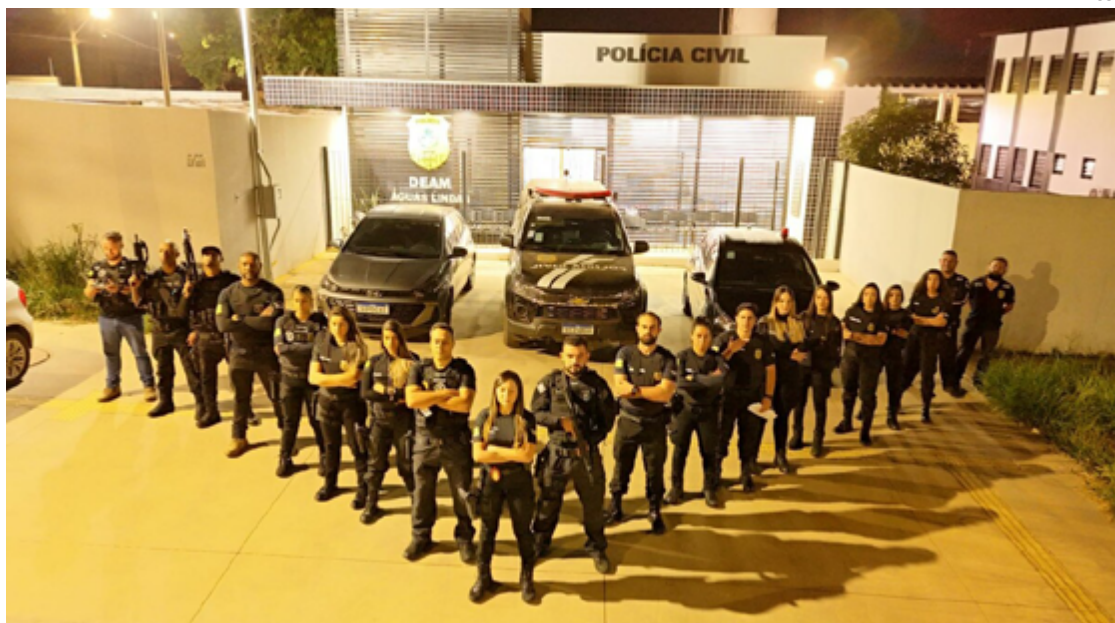
A operação mobilizou 19 policiais que fiscalizaram oito estabelecimentos na cidade

dedicado à conscientização sobre os perigos da exploração sexual infantil e à promoção de medidas preventivas. Durante este período, a Polícia Civil de Goiás realiza palestras em escolas e comunidades, distribui