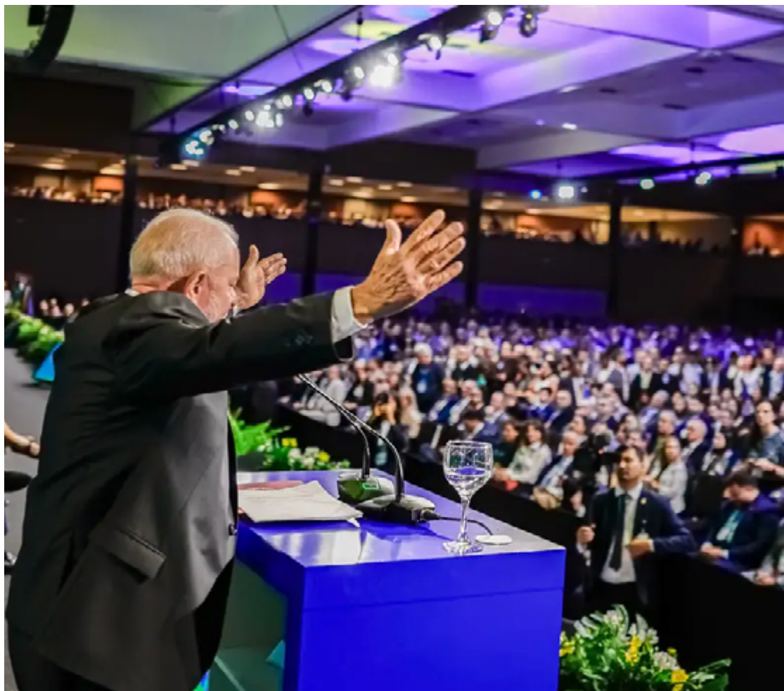
Lula da Silva na Marcha dos Prefeitos, em Brasília: apoio ao pacto federativo

O presidente levou para o evento cerca de 20 ministros, entre eles Fernando Haddad (Fazenda), Rui Costa (Casa Civil), Alexandre Padilha (Relações Institucionais), Camilo Santana (Educação) e Simone Tebet (Planejamento).