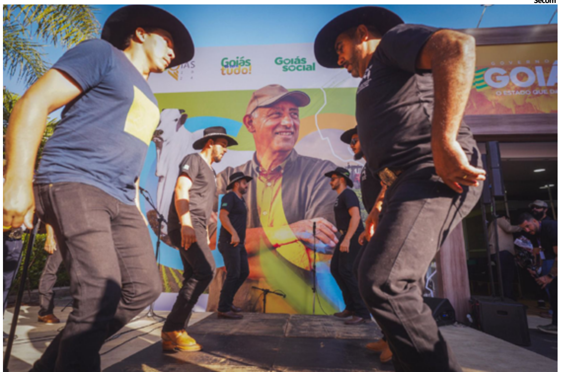
ExpoGoiás marca presença na AgroBrasília 2024 nesta semana

Para o público da feira, a ExpoGoiás vai levar um misto das potencialidades do estado no agronegócio, turismo, cultura e tradições goianas, além de uma experiência imersiva em um túnel que vai transportar os visitantes para o que há de melhor no estado. A proposta é mostrar ao público