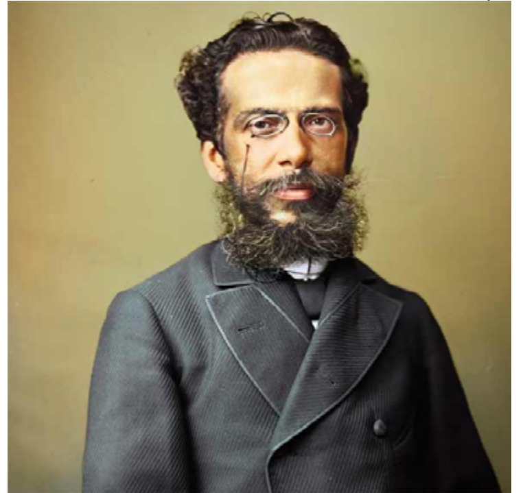
Machado de Assis: autor tem encantado leitores há décadas