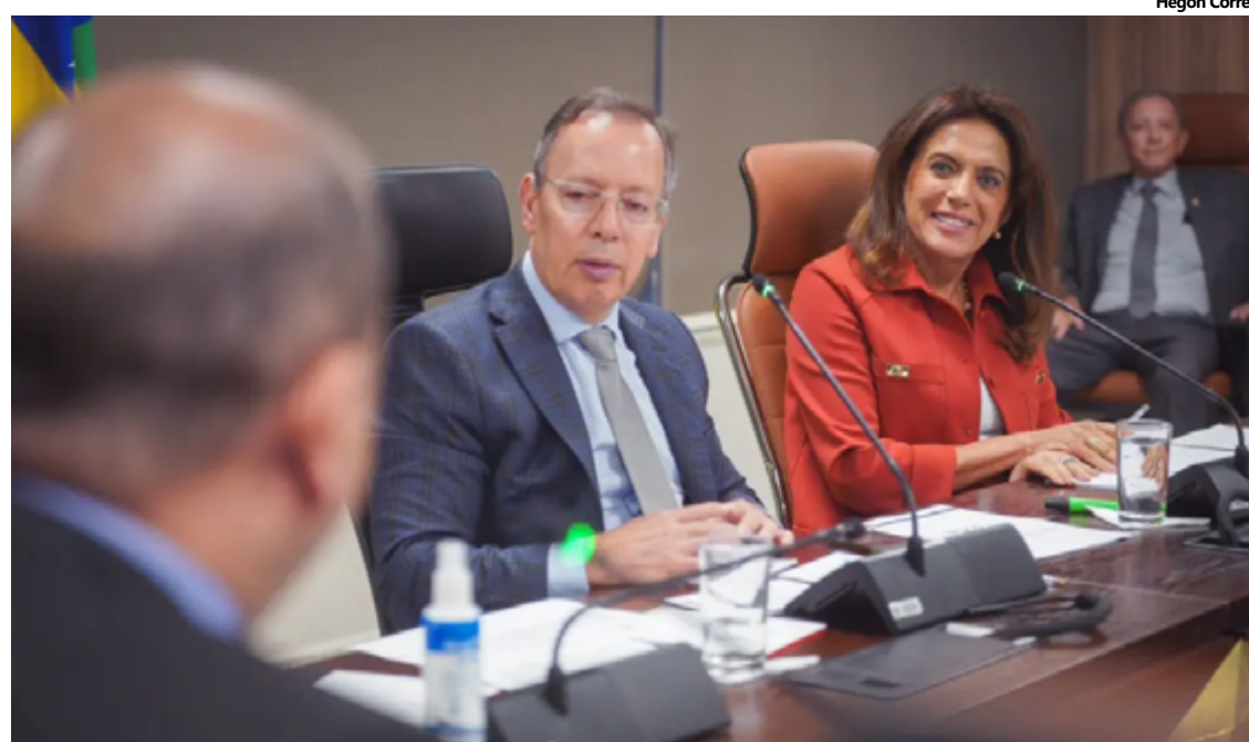
Governo de Goiás faz parceria com TJGO para ampliar ações em comunidades Kalunga

Dentro da iniciativa, o TJ-GO adiantou que irá ampliar serviços públicos do Judiciário para as regiões em que as comunidades estão localizadas, além de dar celeridade aos julgamentos de todos os processos das co-