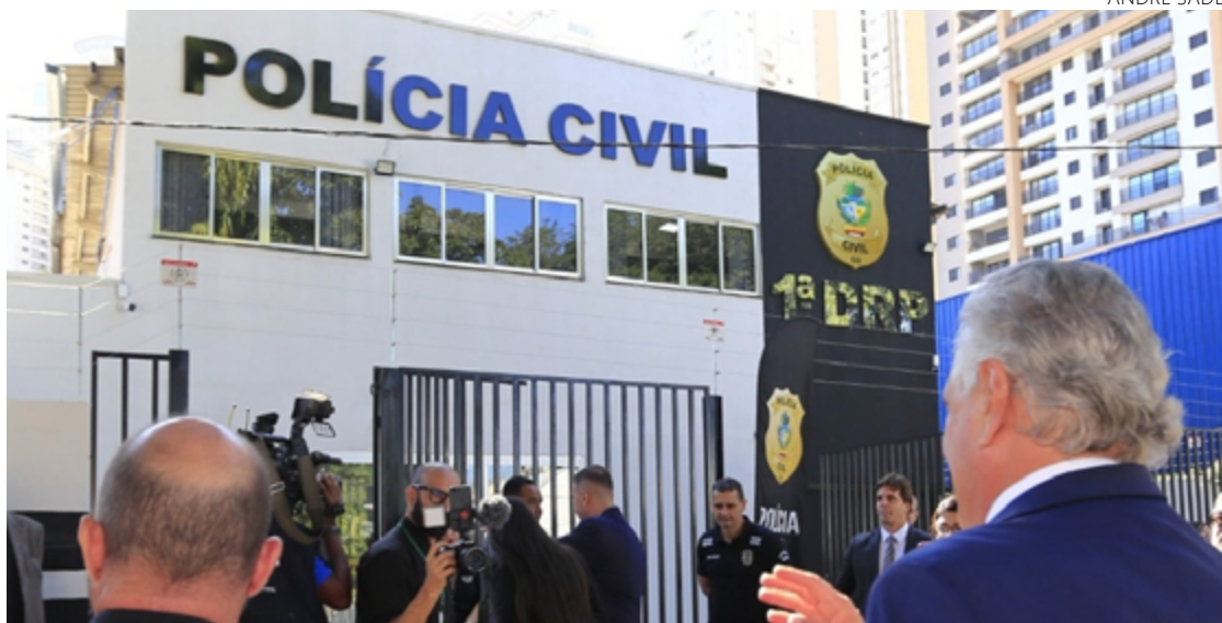
Ronaldo Caiado contempla maior delegacia regional de Polícia Civil de Goiás

“Essa nova delegacia é um espaço a mais para que haja maior uso de tecnologia, além da criação de um grupo especializado para identificar crimes complexos”. Segundo o Governo de Goiás, o imóvel que