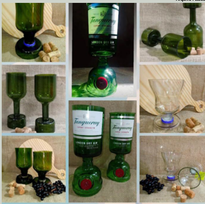
Eles resgatam garrafas de vidro de bosques, ruas e estabelecimentos, transformando-as em copos, taças e tulipas personalizados

Atualmente, Beta busca uma nova colocação no mer-