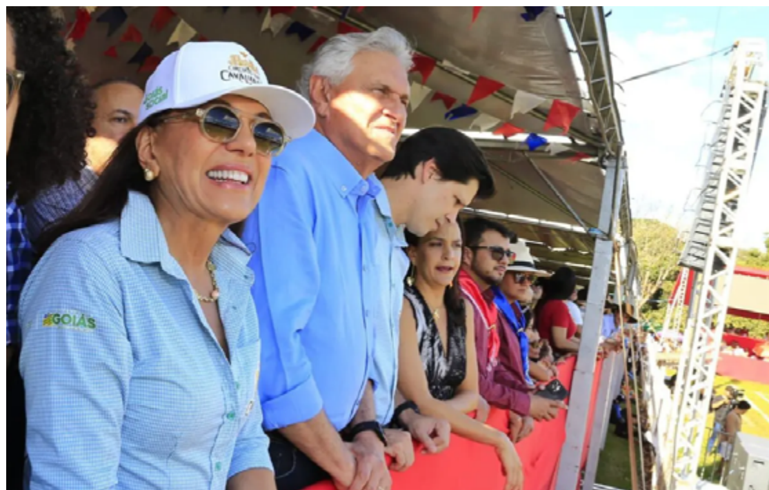
Governador Ronaldo Caiado, primeira-dama Gracinha Caiado e auxiliares durante evento em Pirenópolis: apoio aos municípios por meio do projeto Circuito das Cavalhadas

Caiado ressaltou o compromisso do estado com a cultura e enfatizou a importância das Cavalhadas. "O Governo de Goiás trabalha para incluir cada dia mais cidades no Circuito das Cavalhadas. Tudo aqui é da melhor qualidade, dentro daquilo que é a tradição. Trabalhamos para manter viva essa beleza que é a encenação do combate entre mouros e cristãos e também para movimentar a econo-